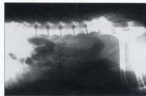
Nach entleertem Darm ist eine Umfangsvermehrung am Beckeneingang erkennbar.

Hätten die Besitzer weiterer Diagnostik zugestimmt, hätten wir eine Endoskopie mit Biopsientnahme durchgeführt. Da diese Untersuchung sehr aufwendig in der Vorbereitung ist (mindestens 36 Stunden Nahrungskarenz, multiple Wassereinflüsse, eventuell Kolon-Elektrolyt-Spülösungen per Magensonde) und die Lokalisation der Umfangsvermehrung nicht gesichert war, haben wir die MRT-Untersuchung zuerst eingesetzt, zumal beim Nachweis von Metastasen alle