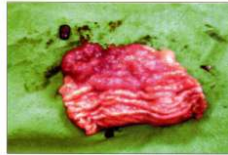
Exzidierte Rektumschleimhaut mit Neubildung

re infrage gekommen, vor allem malignes Lymphom und adenomatöser Polyp, aber auch Leiomyom, Leiomyosarkom, Plasmazelltumor, Fibrosarkom, Siegelringkarzinom oder Karzinoid. Lymphome stellen sich nach unserer Erfahrung in der MRT signalintensiver dar. Polypen wurden von uns noch nicht mittels Kernspintomografie untersucht. Ihre Differenzierung von