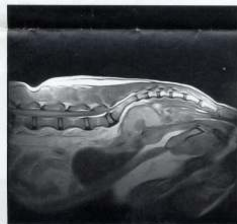
...und im Längsschnitt im MRT

weiteren Untersuchungen überflüssig geworden wären. Die Endoskopie lässt hingegen bereits eine gewisse prognostische Aussage zu: Hunde mit solitären, gestielten Tumoren haben eine Überlebenszeit von 32 Monaten, knotige oder pflastersteinartige Läsionen im Durchschnitt nur zwölf Monate, Tiere mit tumorbedingter zirkulärer Strikturen hatten nur zwei Monate durch-