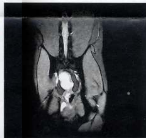
Deutliche Darstellung der Umfangsvermehrung im Quer-

re infrage gekommen, vor allem malignes Lymphom und adenomatöser Polyp, aber auch Leiomyom, Leiomyosarkom, Plasmazelltumor, Fibrosarkom, Siegelringkarzinom oder Karzinoid. Lymphome stellen sich nach unserer Erfahrung in der MRT signalintensiver dar. Polypen wurden von uns noch nicht mittels Kernspintomografie untersucht. Ihre Differenzierung von